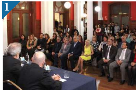
1 MEDIACIÓN Y ECONOMÍA