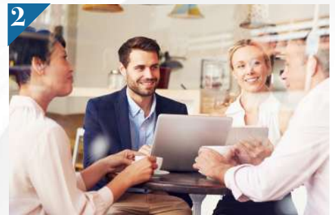
2 LA MEDIACIÓN EN LOS CONFLICTOS EMPRESARIALES Y EN LAS RELACIONES DE NEGOCIO